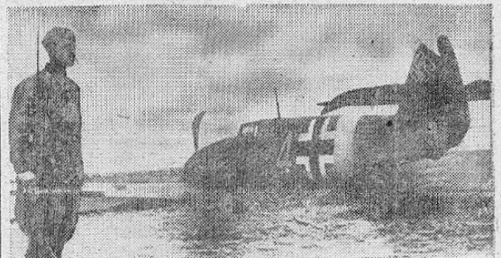
"Este No Volará Más" uno de los muchos aviones nazis derribados en el frente oriental.