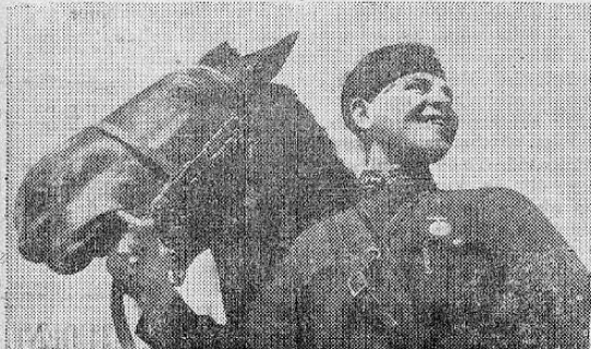
Uno de los héroes de Timoshenko en el sector de Kharkov. Sonríe lleno de fe y optimismo.

In conversation, a few days ago, with one of the agriculturists of this Zone, we were reminded of the age-old proverb — "The one who has clothes on the line watches for the rain". For, our good collaborator, being largely interested in the Estrella Region is very much concerned about the lifting of the tram rails; it was not clear to him that the work in progress is only a means of the "old" giving way to the "new". It is generally understood that the present system is owned privately and, as previously stated, the material is required for utilization in the Abaca Industry. We learn that in keeping with the Executive promise to afford every possible protection to the agricultural activities of this region, particularly the Cahuita district, a contract has already been awarded for the replacement of the out-going means of transportation. In consequence, we urge cultivators to keep courageous and to ever bear in mind that "behind each dark cloud there is a silver lining".