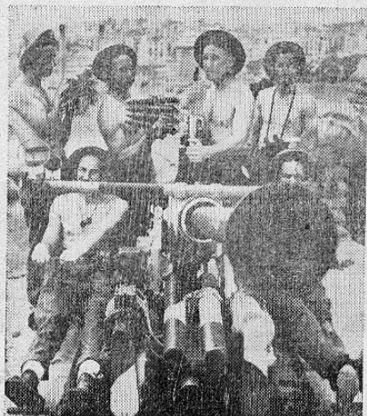
Defensores de la heroica Malta. La isla que se enorgullece de haber resistido millares de ataques aéreos enemigos.